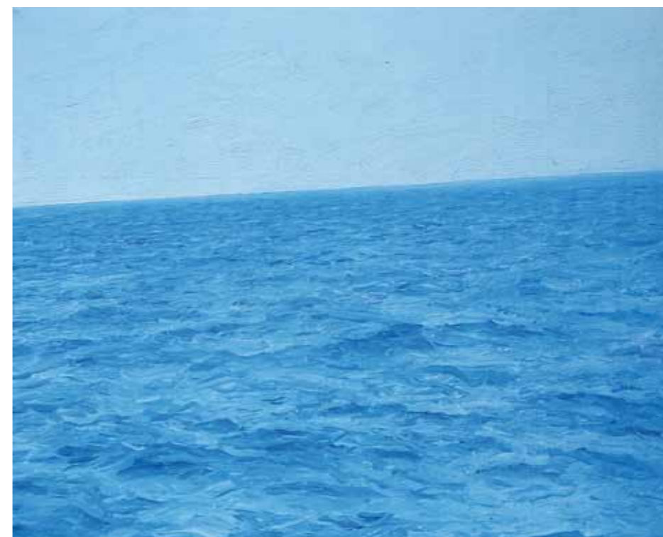
Mare 2009 olio su tela 29 x 36cm