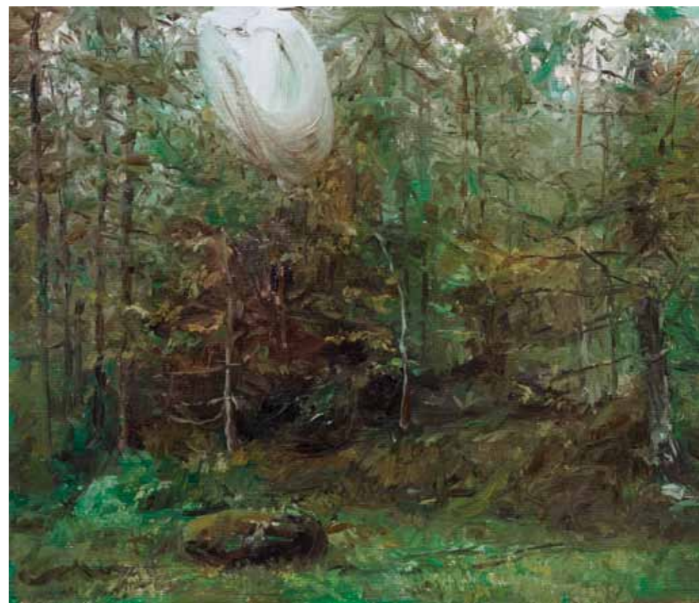
Bosco 2011 olio su tela 24 x 29 cm