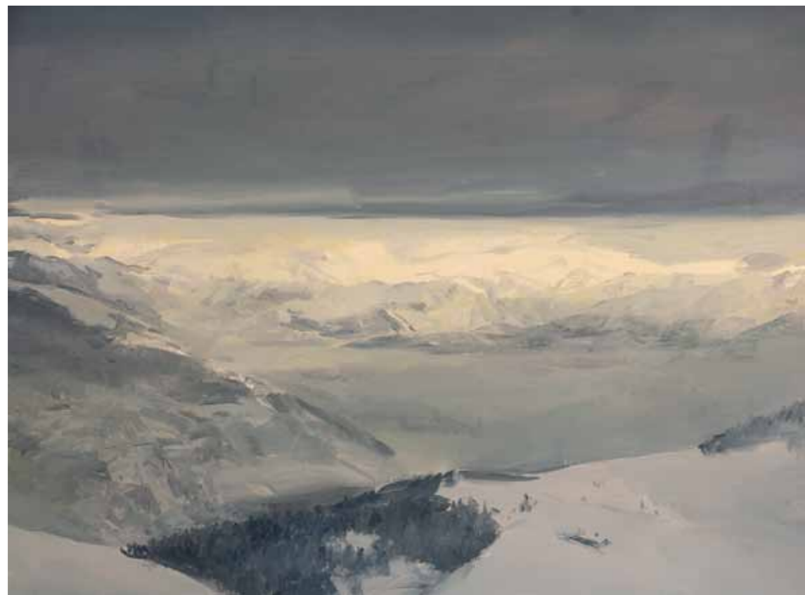
Cime 2010 olio su tela 60 x 80 cm