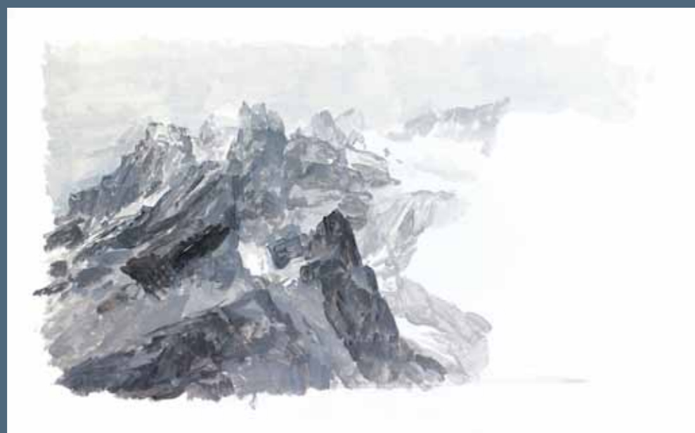
Cime 2010 acrilico su carta incollata su tavola 24 x 38 cm