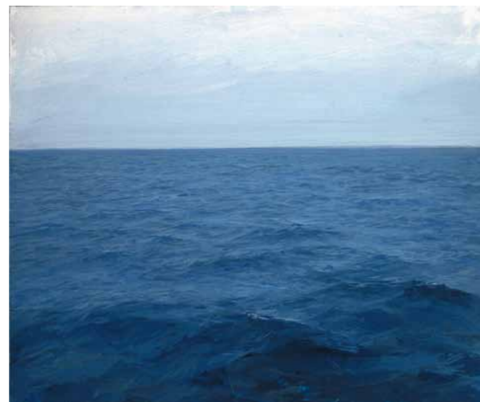
Mare 2012 acrilico su carta intelata 35 x 42 cm