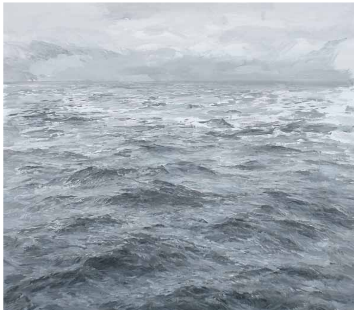
Lago 2012 olio su carta intelata 68 x 78 cm