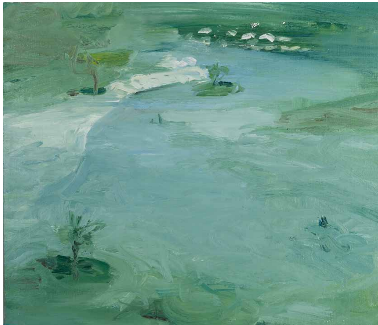
Villaggio 2011 olio su tela 40 x 45 cm