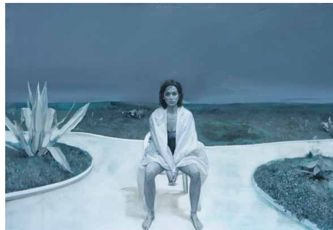
Chiara 2006 acrilico su tela 92 x 135 cm