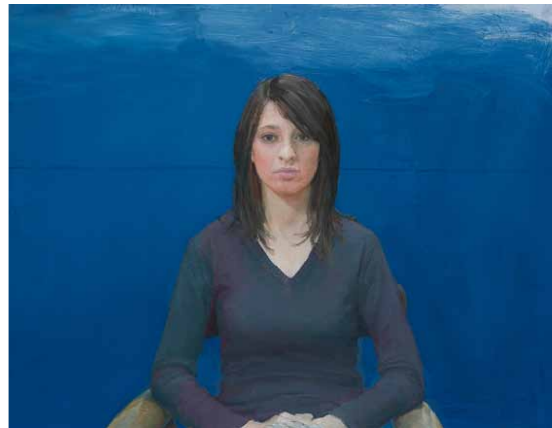
Magda 2010-12 olio su tela 91 x 117 cm