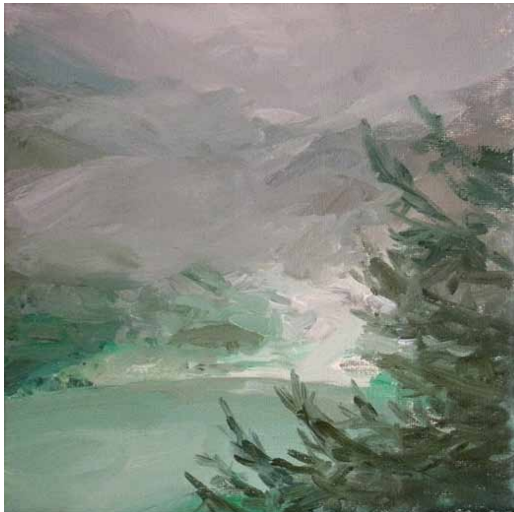
Laghetto artificiale 2011 olio su tela 20 x 20 cm